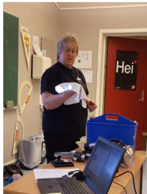
og her om rengjøring av jur og spener før melking